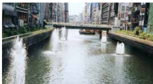
写真1 道頓堀川のエアレーションと太左右衛門橋

写真1は、繁華街を流れる代表的な大阪市内河川道頓堀川で、依然として水色や透明性、夏場の悪臭、などで、訪れた人々や地元住民からはまだまだ改善の要望が強いものです（同誌2004年4月号より）。