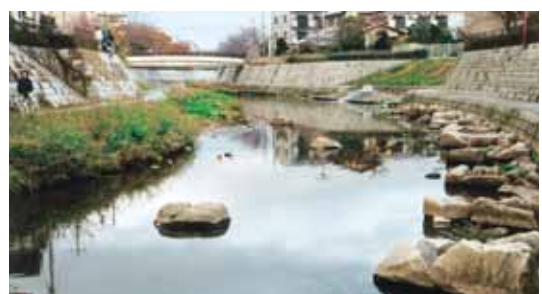
写真2 上流部園田学園女子大学付近の修景された庄下川

7月号以降の掲載予定を示すと、明神川（京都市）、長瀬川（東大阪市）、生駒の川（東大阪市）、有馬川（神戸市）、いたち川（横浜市）、赤野井湾流入河川（守山市）、天の川（枚方市&交野市）、津門川（西宮市）、寝屋川北部（寝屋川市）、大阪市内河川河口部の渡し、となっています。